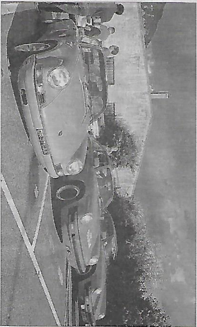
Les Porsche étaient là, évidemment. Morgan, de l'équipe "Le Snyule" de la Vallée Verte. Une Austin-Healey.