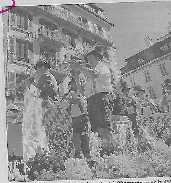
La Musikkapelle de Partenkirchen vient à Chamonix pour la 45 e fois.

Informations sur le site : chamonix.com .