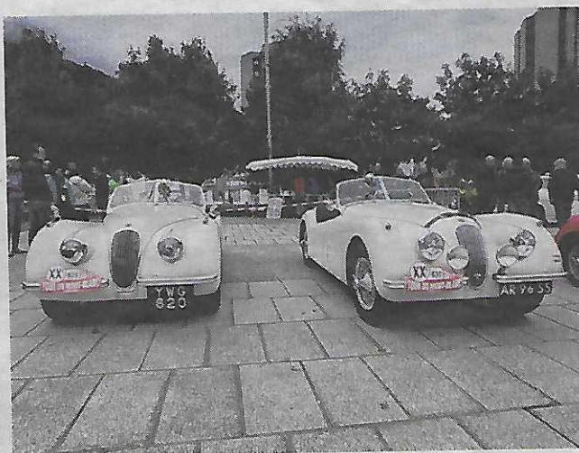
Malgré la pluie et les nuages, les participants étaient nombreux à se rendre place du Mont-Blanc pour admirer les véhicules.